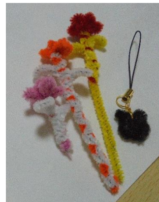
自主製品づくり 器用