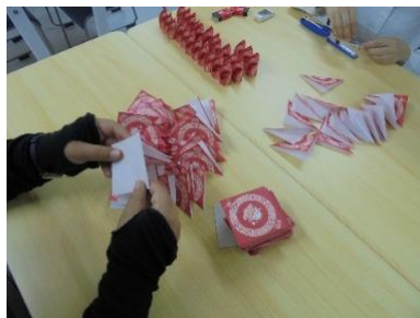
内 職 根気が必要