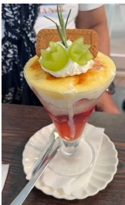
外 食 ウッフ