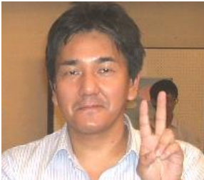
火傷した時じゃありません

両親を連れて正月の買い出しへ行きました。左折する際、車中でお湯を沸かしていたケトルが転がり足元へ…年の瀬も迫る大晦日。83歳になる母親が「バカだな」とつぶやく。火傷を負ってしまった私は左足が痛くて、痛くて救急外来へ。