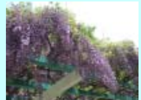
(アカシア公園で咲いた藤)