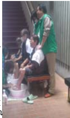
< 足湯支援。心も身体も温まります >

被災地支援から帰ってきてもうすぐ1ヶ月。生々しかった現地の様子もだんだんと薄れてきています。東日本大震災は原発のことを考えると日本全体の問題になっていると思います。私を含め一人ひとりが、他人事ではなく自分は何が出来るかという気持ちを、引き続き持つことが課題だと感じています。