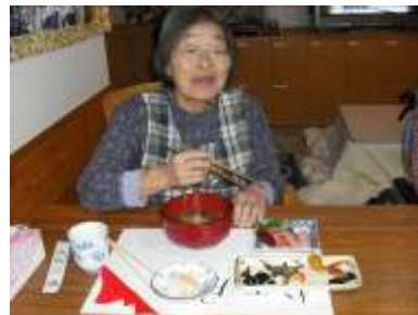
← コ タ ツ

ご家族とお出かけになられた利用者さんも数名いらっしゃりいつもより人数は少なかったのですが、その分密に過ごしました。雑煮のお餅に代わる芋餅作りもあり、正月といえどもいつも通り家事はしっかりなされてました。初詣もしっかり行きましたよ！