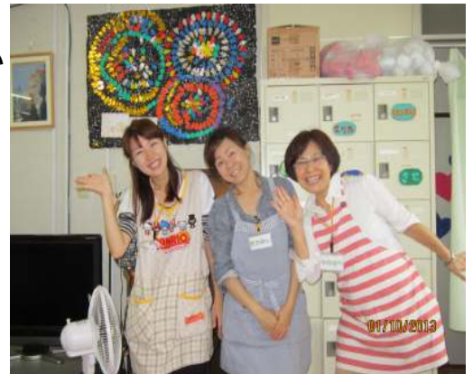
美人ぞろいデース お待ちしています

1人ひとりの方に笑顔が生まれる通所介護事業所でありたい。楽しく元気にいつまでも通って頂けるようスタッフ一同皆様のご利用をお待ちしています。