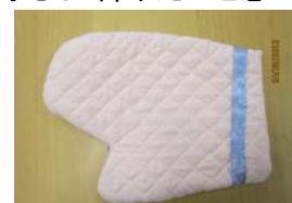
温かみのある鍋つかみ

最近は通所が楽しくなったようで、しっかりと準備をして外で待っていてくれます。もともと話し好きの方ですから「ふれあい倶楽部」でいろいろな方とおしゃべりをする